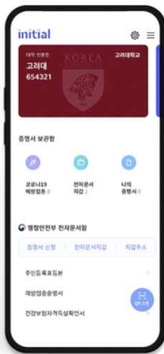
▲ 모바일 학생증

고려대학교는 모바일 학생증 및 금융(내국인 대상) 학생증을 발급하고 있습니다. 학생증(모바일 또는 금융)을 소지하지 않은 경우, 교내시설(도서관 및 각 건물) 이용에 제한될 수 있습니다.